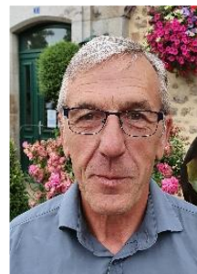
66 ans retraité