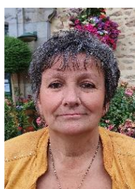
62 ans retraîtée