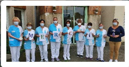
Les agents de l'EHPAD mobilisés