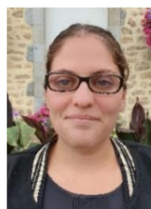
31 ans gérante d'une pension canine