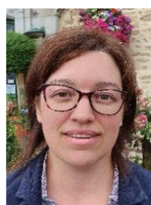
40 ans comptable