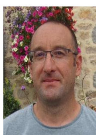
43 ans technico-commercial