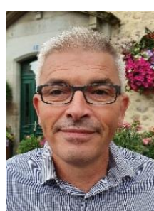
53 ans commerçant