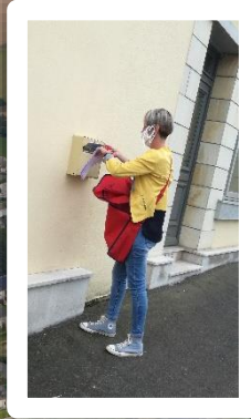
Les bénévoles distribuant des masques