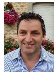
47 ans infirmier anesthésiste