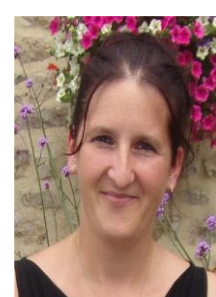
40 ans aide-soignante