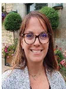
46 ans assistante maternelle & auto entrepreneuse