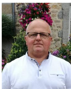
49 ans agriculteur