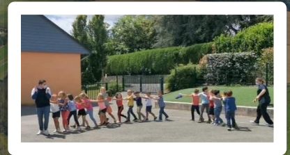
Les agents municipaux au périscolaire